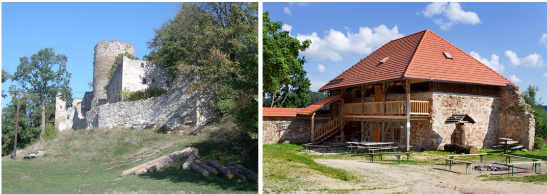
Ruine Prandegg (li.), Zehentstöckl (re.), (beide Burgverein Prandegg)