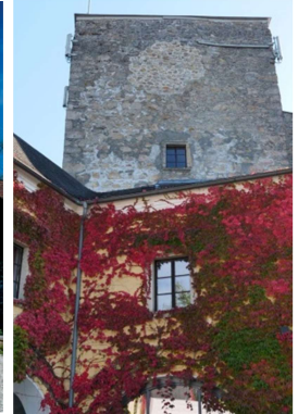
Burg Clam (li.; C. Clam), Burg Kreuzen (mi.; Stiftung Kreuzen, re.; Stiftung Kreuzen - Riepl)