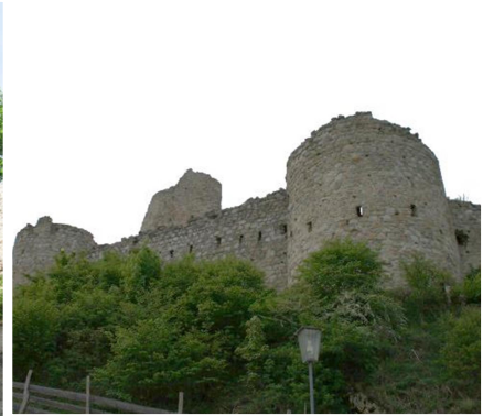
Rutenstein (li. u. mi. REV, re. VMA - Hunger)