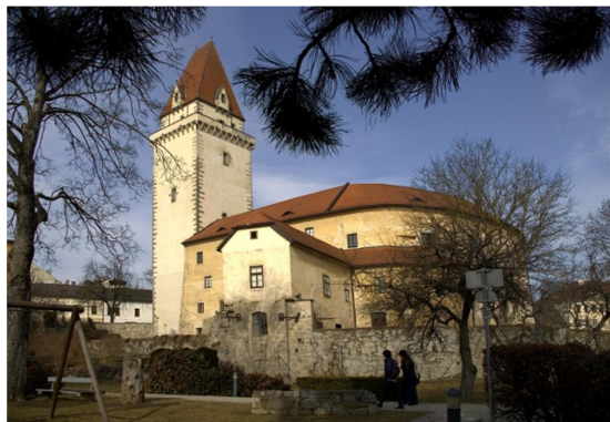
Burg Dornach (re., Gem. Lasberg), Schloss Freistadt (re., Schlossmuseum Freistadt)