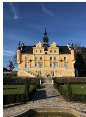
Reichenstein (li., Museum Reichenstein; mi., VMA - Hunger), Schloss Tannbach (re., Weißengruber)