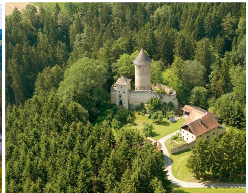
Schloss Tannbach (li., Weißengruber); Schloss Weinberg (mi., Weinberg – Schneider), Burg Dornach (re., Gem. Lasberg)