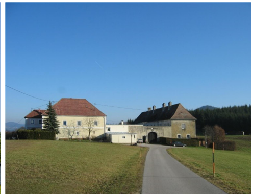
Burg Windhaag (li., Gem. Windhaag), Altenburg (mi., Gem. Windhaag), Schloss Zellhof (re., TV Bad Zell)